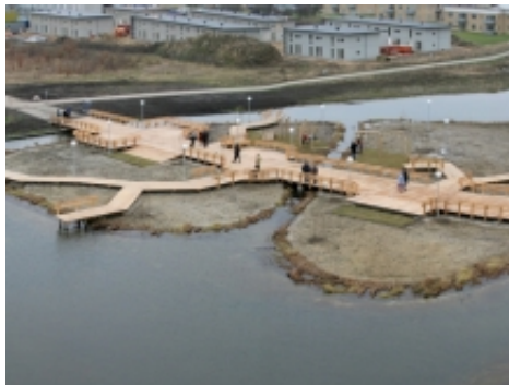
Broen i Trekrone . af billedkunstner Nils Norman i samarbejde med landskabsarkitekt Ib Asger Olsen. Kunsten har her tilføjet et legende og sanseligt element.

"Kunstnere kan nogle gange være i stand til at se tendenser og interesser i et lokalområde, som de lokale selv endnu ikke er i stand til at formulere. På den måde kan kunstnere hjælpe byfornyelsen i en retning, som også er interessant for de lokale. Det allerbedste er hvis man arbejder med selvudviklende projekter, som starter småt men udvikler sig med tilføjelser og lag over tid – gerne lang tid," siger Peter Schultz Jørgensen.