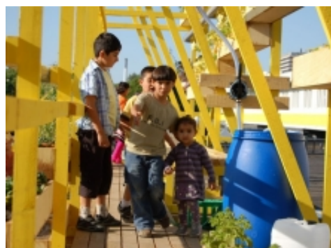
Nyttehave skabt af kunstnere og arkitekter under SOUP – Sol Over Urban-Planen i 2008, hvor de lokale kunne producere egne grøntsager.